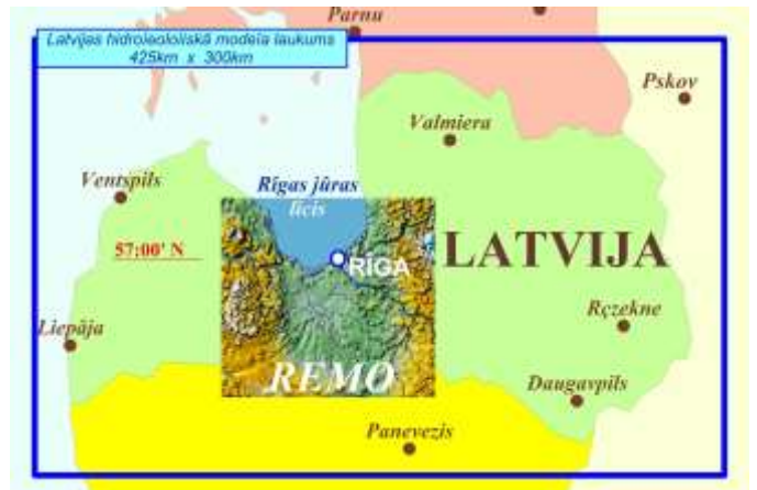
1. att. Reģionālo hidroģeoloģisko modeļu izvietojums

Pazemes dzeramā ūdens krājumu pārvaldību LVĢMC nodrošina turpat 15 gadus veidota un uzturēta digitālo datu kopa par ūdensapgādes, ģeoloģiskās izpētes un monitoringa urbumiem. Tomēr pastāvošā datu analīzes pieeja, pilnībā nenodrošina pazemes dzeramā ūdens pārvaldības plānošanu 3-5, 10 vai 25 gadu ilgā laika posmā un tas ir pretrunā ar ES ūdens Direktīvu un racionālas zemes dziļu resursu pārvaldības politiku.