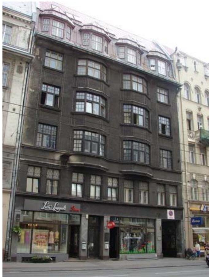
2. att. Ēka Rīgā, Brīvības ielā 70, kur no 1921. līdz 1931. gadam darbojās Krievu Universitātes kursi un Krievu Universitātes zinātņu institūts.