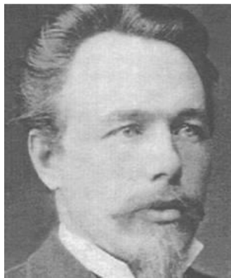
1. att. Karls Frīdrihs Glāzenaps.

Rīdlinieks Karls Frīdrihs Glāzenaps ( C. F. Glasenapp , 1847–1915) ir pazīstams tālu ārpus dzimtās pilsētas, jo ir pirmais vācu komponista Riharda Vāgnera ( R. Wagner , 1813–1883) biogrāfs, un viņa darbi tiek lasīti un pēti joprojām.