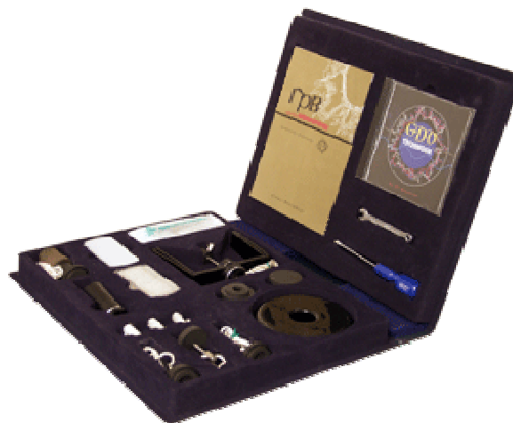
1.att. Palīgierīču komplekts bioloģisku objektu testēšanai „GDV Mini-Lab” [3]

Šķidrumu testēšanai ar „GDV Camera” nepieciešamas palīgierīces no komplekta „GDV Mini-Lab” (skat. 1.att.).