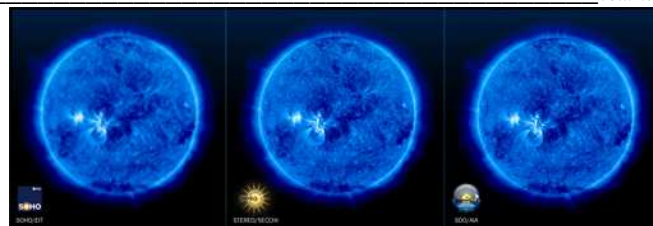
3. att. satelītu SOHO, STEREO un SDO iegūto attēlu izšķirtspējas salīdzinājums

The next maximum of solar activity is expected on May 2013. During this period the far ultraviolet portion of the solar spectrum intensifies, reaching Earth's ionosphere making it thicker and denser. Space weather is significantly influenced. The definition of space weather in U.S. National Space Weather Program Strategic plan is following: "conditions on the sun and in the solar wind, magnetosphere, ionosphere, and thermosphere that can influence the performance and